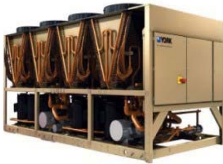
Gambar 2. 2. Air Cooled Chiller

digunakan adalah jenis Air Cooled System . Chiller ini menggunakan refrigerant sebagai fluida dan udara sebagai media pendingin kondensornya.