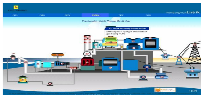
Gambar 1. Pusat Listrik Tenaga Gas dan Uap (PLTGU) [2]

Tujuan penelitian ini adalah untuk menentukan nilai exergy physical dan exergy chemical yang terjadi di HRSG dan menentukan nilai exergy destruction tiap-tiap komponen di HRSG. a.Menentukan nilai efisiensi exergy HRSG dan efisiensi energi secara keseluruhan dan efisiensi tiap-tiap komponen.