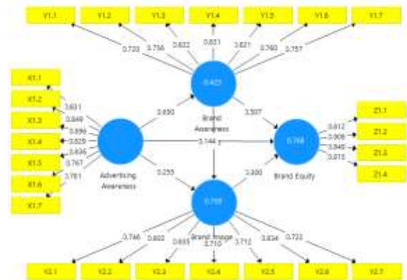
Gambar 1. Hasil PLS Alogaritm

Dari Hasil Tabel 3, dapat dijelaskan bahwa baik itu variabel independen (variabel eksogen) maupun variabel dependen (variabel endogen)