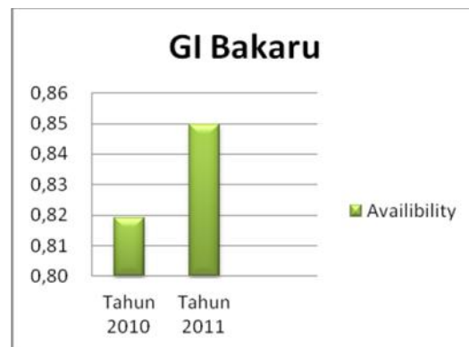
Gambar 1 Grafik ketersediaan penyulang Bambapuung GI Bakaru tahun 2010 sampai dengan tahun 2012 sebelum ada GI Sisipan Enrekang.