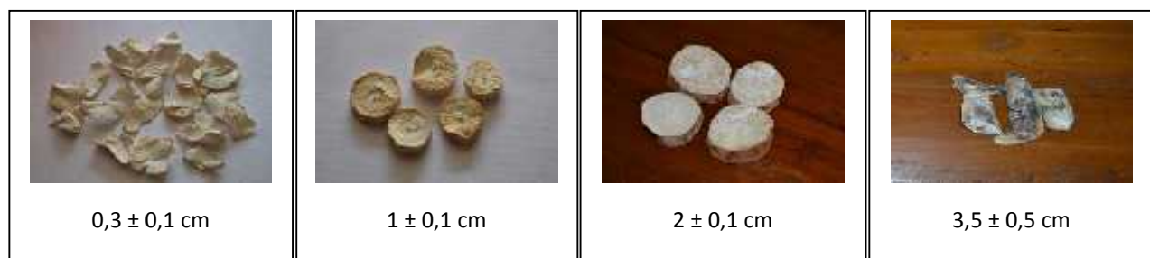
Gambar 1. Penampakan irisan ubi kayu kering pada berbagai perlakuan ketebalan irisan ubi kayu

Perbedaan lama pengeringan juga akan berpengaruh terhadap penampakan irisan ubi kayu, seperti dapat dilihat pada Gambar 1. Pada Gambar 1, terlihat bahwa ubi kayu dengan tebal irisan 3,5 ± 0,5 cm, selama proses pengeringan akan ditumbuhi kapang dari genus Aspergillus . Menurut Oramahi dan Ashari (2008), kapang A. Flavus merupakan kapang yang paling dominan tumbuh dan penyebab kerusakan terbesar pada gaplek. Glukoamilase yang dihasilkan oleh A. flavus mampu mendegradasi pati menjadi glukosa sehingga aktivitas ini dapat digunakan sebagai indikator awal serangan jamur pada gaplek sebelum kerusakan secara fisik (warna jamur) tampak.