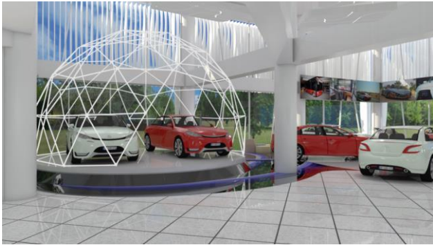
Gambar 7. Ruang Lobby dan Area Pamer View 3

View2 dari area yang mendisplay motor elektrik terbaru yaitu GESITS dengan konsep background terdapat coretan – coretan rumus yang dijadikan wall art .