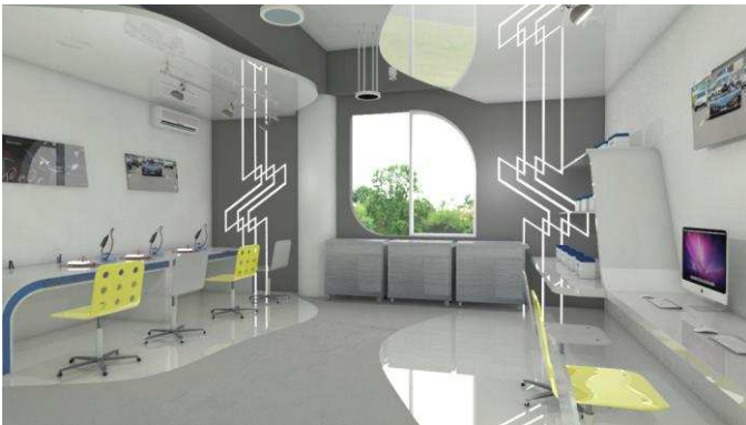
Gambar 8. Ruang Prototype View 1

Penggunaan material utama pada ruangan ini adalah concrete , HPL, glossy dan matte finish (cat). Furniture yang digunakan menggunakan konsep simple dan futuristik dengan material hpl glossy .