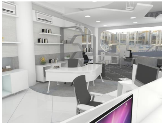
Gambar 11. Ruang Kantor View 2

Pada view ini ingin memperlihatkan konsep dinding yang terdapat rak melayang dan hidden lamp yang ada pada dinding. Hidden lamp menjadi aksen tersendiri pada ruangan sehingga memberikan kesan ruangan yang berkarakter mengingat bentuk lampu menyesuaikan transformasi bentuk yang sudah dibuat.