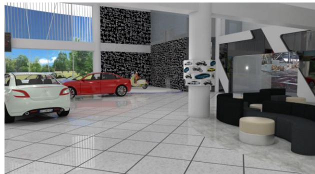
Gambar 6. Ruang Lobby dan Area Pamer View 2

Menggunakan pencahayaan hidden lamp pada elemen estetis di dinding sehingga memberikan efek dramatis pada area tersebut dan mempertegas bentuk – bentuk tersebut agar dapat dilihat.