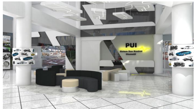
Gambar 5. Ruang Lobby dan Area Pamer View 1

Permainan hanging plafond langsung mengarahkan kita ke arah resepsionis memfokuskan kita langsung melihat ke arah logo PUI pada backdrop yang menjadi point of interest ketika baru memasuki area lobby . Melakukan pengulangan pola yang ada pada lantai untuk lebih menyatukan desain satu sama lain.