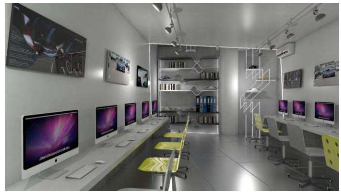
Gambar 9. Ruang Lab View 2

Konsep pola lantai dan plafond memberikan pembeda disetiap area didalam ruangan yaitu antara area kerja, area penyimpanan dan sirkulasi.