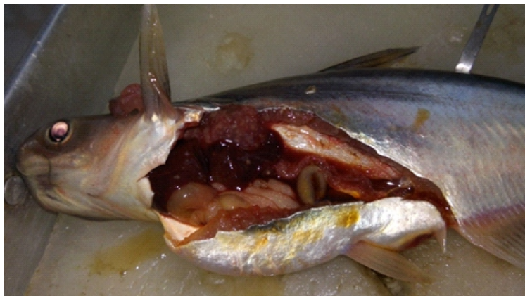
Gambar 1. Gejala klinis Ikan yang terinfeksi Edwardsiella ictaluri

yang dimiliki oleh metode tersebut. Hasil penelitian menunjukkan bahwa test kit yang diproduksi mampu mendeteksi E. ictaluri dengan lebih cepat, lebih sederhana dan ekonomis dibandingkan uji aglutinasi slide atau biokimia konvensional. Sampel dari lima lokasi yang terdeteksi positif E. ictaluri menunjukkan gejala klinis swirling , lethargic , dan berenang di permukaan sebagaimana juga diungkapkan Austin dan Austin (2007) dan Hawke et al (1979). Terdapat bintik atau nodul – nodul putih pada organ dalam terutama hati dan limpa. (Gambar 1).