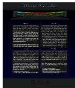
Gambar8. Tampilan Menu Teknik

Berisi tentang teknik dasar permainan bola voliseperti teknik servis, passing , smash , dan blocking . Dijelaskan pula teknik penyerang dan pertahanan yang baik dan benar.Tampilan menu teknik sepertigambar dibawah ini: