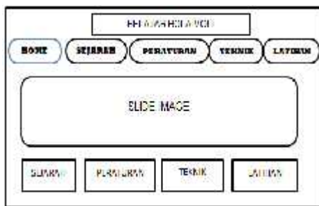
Gambar4. Rancangan Tampilan Home

Membuat desain tampilan website secara terperinci mulai dari perancangan tampilan beranda (home), sejarah, peraturan, teknik, dan latihan soal. Sebagai gambaran salah satu rancangan tampilan beranda (home) seperti gambar dibawah ini: