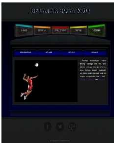
Gambar 9. Tampilan Menu Latihan

Berisi tentang pilihan menu soal latihan untuk menguji pengetahuan dalam olahraga bolavoli, dimana pada halaman ini berisi 3 halaman soal latihan yang dapat digunakan untuk mengerjakan soal. Tampilan menu latihan seperti gambar dibawah ini: