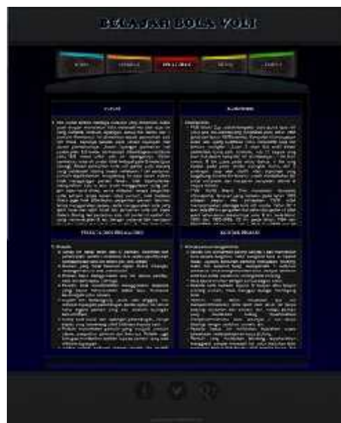
Gambar 7. Tampilan Menu Peraturan

dalam permainan bolavoli mulai dari aturan lapangan,peserta,hingga kontak pemain.dijelaskan pula kompetisi bolavoli baik internasional maupun nasional. Tampilan menu peraturan seperti gambar dibawah ini :