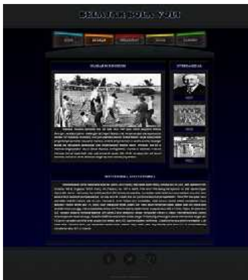
Gambar 6. Halaman Menu Sejarah

Tampilan menu sejarah seperti gambar dibawah ini: