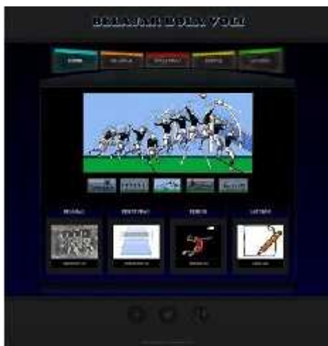
Gambar 5 . Halaman Menu Utama