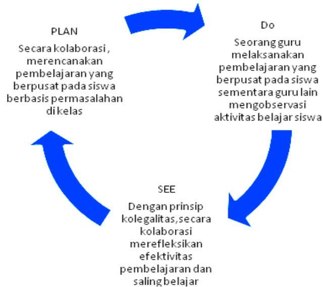
Gambar 1: Siklus Pengkajian Pembelajaran dalam lesson study.

Berikut ini disajikan gambar 1 siklus lesson study .