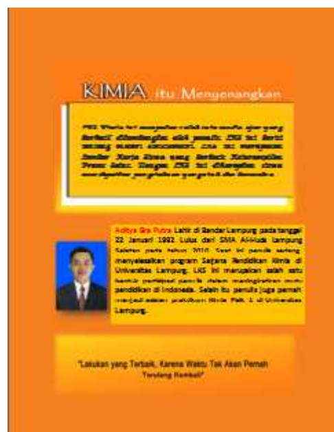
Gambar 3. Cover luar bagian belakang

Cover luar bagian belakang dapat dilihat pada gambar di bawah ini.