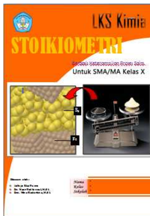
Gambar1. Cover luar bagian depan

Adapun Cover luar bagian depan dapat dilihat pada gambar di bawah ini.