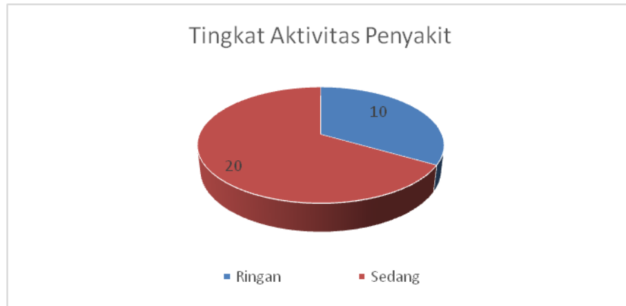
Gambar 1. Distribusi pasien LES berdasarkan tingkat aktivitas penyakit