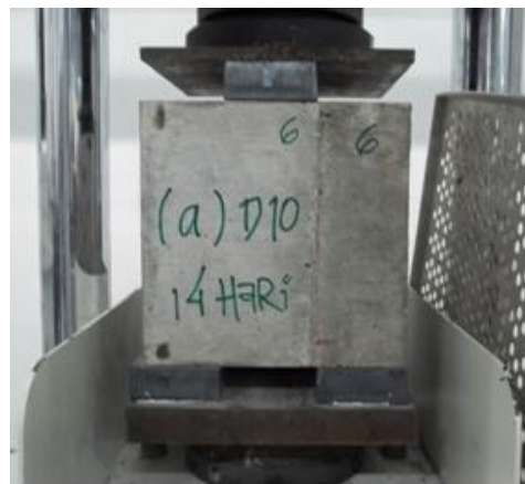
Gambar 1 : Pengujian Geser Interface

Pembebanan diberikan oleh hydraulic jack dengan pembebanan bertahap, dengan sistem pembebanan yang digunakan adalah load control . Pembebanan diberikan dengan nilai loading rate sebesar 15 N/mm 2 /menit secara bertahap hingga beban mencapai beban maksimum yang mampu ditahan oleh kubus beton, yang ditunjukkan dengan adanya retakan yang terjadi pada daerah interface antara beton lama dan baru.