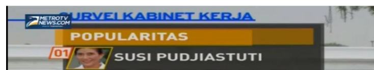
Gambar 1: Survei Popularitas Kabinet Kerja Jokowi