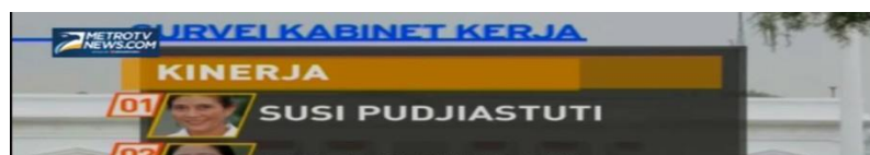
Gambar 1: Survei Kinerja Kabinet Kerja Jokowi

Latar belakang Susi Pudjiastuti serta kepribadiannya yang baik, membuatnya menjadi seorang menteri yang dikenal baik oleh masyarakat dengan hasil kinerja yang baik dalam kabinet kerja Joko Widodo (Jokowi). Selain itu, dalam melakukan sesuatu, perlu dilakukan komunikasi. Sehingga apa yang disampaikan oleh Susi Pudjiastuti kepada rekan kerjanya dapat terlaksana dan terorganisasi dengan baik.