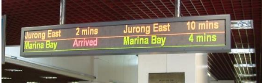
Gambar 4.1 Display Running Text ( Jadwal Waktu Kedatangan)

untuk lebih baik kedepannya pada kualitas waktu tunggu yang ada saat ini, dalam menunjang kepastian pengguna untuk menggunakan sarana BRT, sebaiknya diberikan jadwal waktu kedatangan (Running text) seperti di Negara Singapura secara terperinci agar pengguna dapat mengerti pasti pada saat menunggu kedatangan bus, seperti gambar dibawah ini :