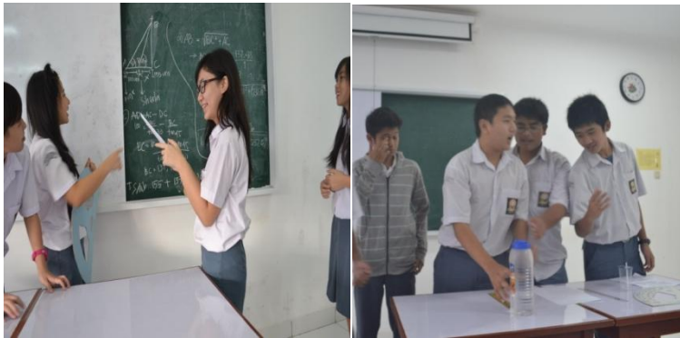
Gambar 4. 1 Persentasi siswa