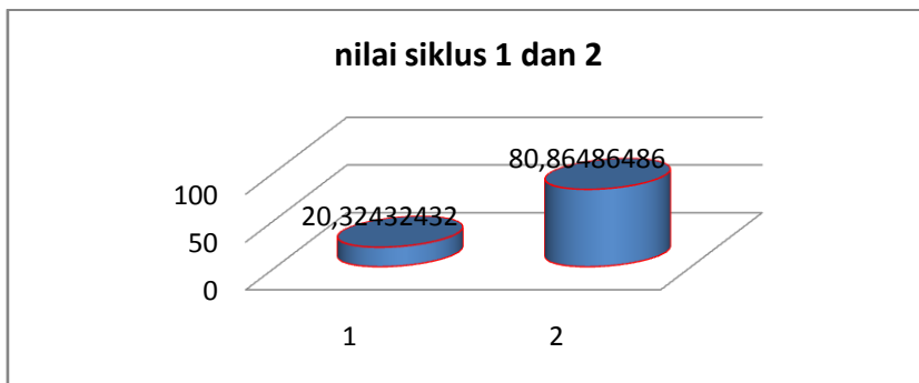
Grafik 4.2 Nilai siklus I dan II

Berdasarkan tabel dikerjakan siswa memecahkan masalah mengalami kemajuan atau peningkatan. Rubrik atau kategori penilaian dapat dilampirkan. Perubahan kemampuan pemecahan masalah pada siklus II ini lebih mengalami peningkatan dari pada siklus I, ini bisa terlihat pada perubahan kemampuan pemecahan masalah tiap siklus dapat di lihat pada grafik 4.2 berikut.