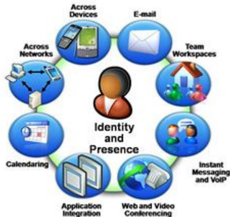
Gambar 2. Contoh interaksi Unified Communication

Dengan mengarahkan seluruh perangkat komunikasi ke perangkat sentral, maka semua penggunaannya dapat dengan leluasa mengakses dari manapun, dengan cara apapun, baik melalui PDA, laptop, ponsel maupun PC masing-masing pengguna. Ini tentunya sangat bermanfaat dalam mengurangi kompleksitas dari perangkat komunikasi yang dipergunakan. Selain itu juga dari sudut pandang perusahaan atau organisasi, tentunya pemakaian Unified Communications ini juga sangat efektif dalam menekan angka investasi terhadap pemakaian berbagai macam alat komunikasi yang berbagai macam dan terpisah.