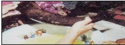
Gambar 3. Tanduk bertulisan Incung pusaka Datuk Singarapi Putih Kel. Sungai Penuh.