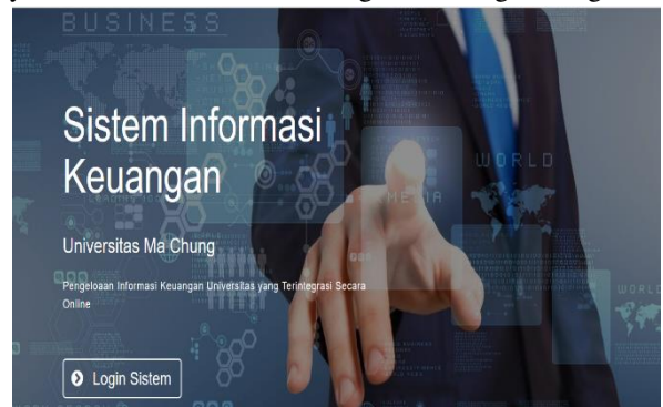
Gambar 4: Tampilan Home

Adapun hasil implementasinya sebagai berikut: User interface Home Login berfungsi sebagai media filtering hak akses pengguna sesuai dengan levelnya yaitu admin, mahasiswa, bagian keuangan, bagian