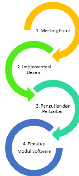
Gambar 1: Diagram Alir Metode Penelitian

Seperti tampak pada gambar 1 tentang diagram alur