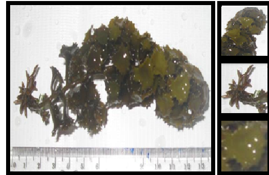
Gambar 1. Bagian-bagian talus T. decurrens : (a) T. decurrens , (b) tipe percabangan ferticillate , (c) holdfast berbentuk cakram, dan (d) filoid berbentuk segitiga corong bergerigi (Dokumentasi Penelitian, 2014).

pernyataan Taiz dan Zeiger (2002) yaitu proses pembentukan senyawa metabolit sekunder (senyawa yang berpotensi sebagai antioksidan) berawal dari pembentukan senyawa metabolit primer yang dihasilkan dari proses fotosintesis. Hasil pengamatan bagian-bagian talus T. decurrens ditampilkan pada Gambar 1.