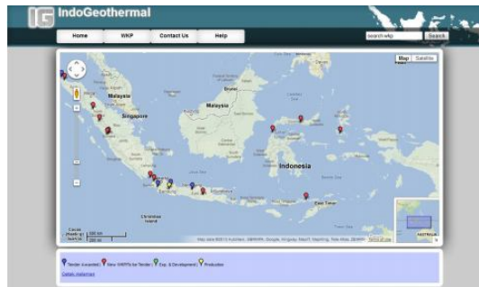
Gambar 9. Map WKP