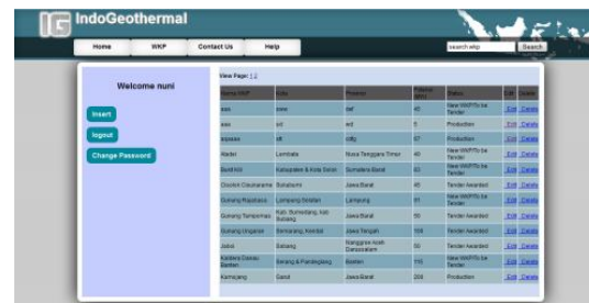
Gambar 6. Halaman View Admin

Untuk masuk kehalaman user cukup dengan mengetik alamat website pada web browser. User akan langsung melihat tampilan halaman utama (home).