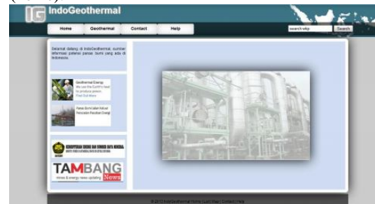
Gambar 7. Halaman Home Pengunjung

Untuk masuk kehalaman user cukup dengan mengetik alamat website pada web browser. User akan langsung melihat tampilan halaman utama (home).