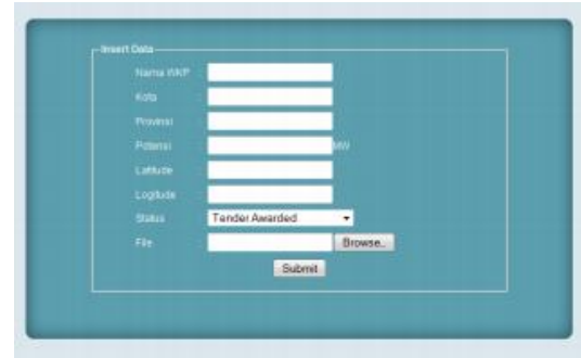
Gambar 4. Insert form