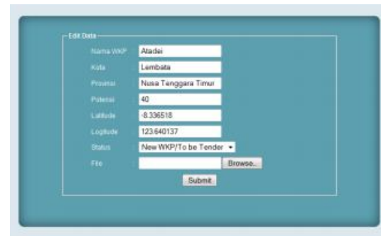
Gambar 5. Edit Form