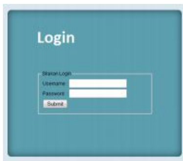
Gambar 3. Form Login

Dalam halaman admin dapat melakukan proses pengolahan data wkp yaitu insert, edit, dan delete.