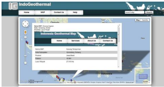
Gambar 1. Uji Coba Black Box