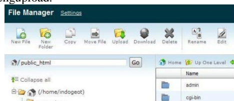
Gambar 11. File Manager

File manager adalah fasilitas dalam cPanel yang berguna untuk mengupload file-file website ke server hosting. Berikut adalah langkah-langkah mengupload: