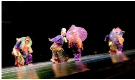
Gambar 2.

saja, berada di depan panggung sehingga lebih mudah diatasi oleh para penari sehingga bisa menggunakan tata pentas seperti tata lampu, seting atau properti panggung lainnya.