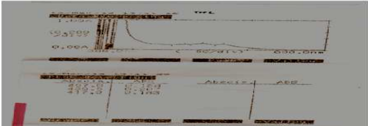
Gambar 2. Pola spektra Th1

pada dinoflagelata serta endosimbion alga. Dinoxanthin memiliki rumus molekul C_{42}H_{58}O_5 . Pigmen bakteri tersebut berada pada kisaran serapan panjang gelombang karotenoid yaitu 300-600nm. Pola spektra Th1 terlihat pada gambar 2.