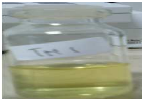
Gambar 1. Pigmen bakteri Th1

Sebanyak 10 ml pigmen diuapkan dengan gas N 2 untuk menghilangkan pelarut sehingga didapatkan ekstrak kasar pigmen sebanyak 0,02 gram. Pigmen bakteri dianalisis dengan menggunakan spektrofotometer UV-Vis 1601 menggunakan pelarut aseton (Gross, 1991). Pelarut ini dipilih karena banyak digunakan dalam identifikasi pigmen karotenoid dengan menggunakan alat spektrofotometer. Pigmen Th1 terlihat pada gambar 1