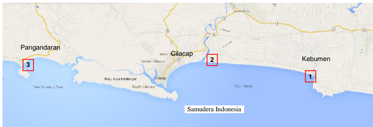
Gambar 1. Lokasi tinjauan.