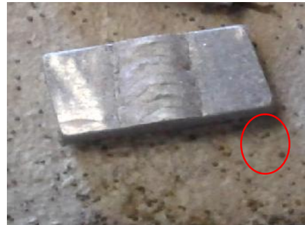
Gambar 1. Sudut atau pinggiran material yang telah ditiruskan mengurangi tegangan permukaan yang selalu cenderung mengurangi ketebalan cat pada sudut-sudut yang tajam dengan cara dibundarkan/ditiruskan.