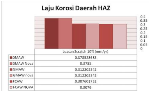
Gambar 2. Grafik perbandingan perhitungan laju korosi dengan Hukum Faraday dengan software NOVA dengan luasan 10%

3. Semakin besar nilai rapat arus ( I_{corr} ), semakin besar juga nilai laju korosi, begitu juga sebaliknya.