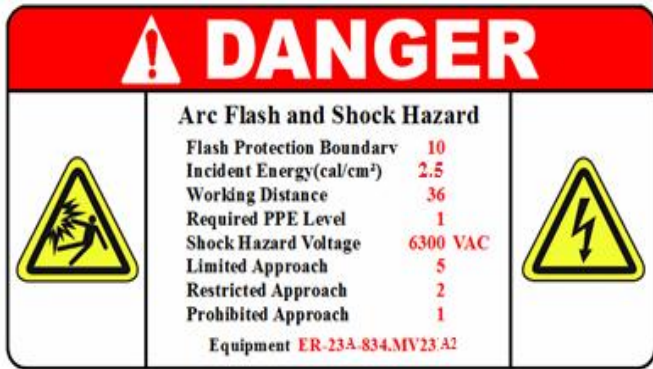
Gambar 3. Label ER-23A-834.MV23A2

Kacamata memberikan perlindungan yang lebih rendah, dalam kategori 1 ini kacamata bias dipakai jika membutuhkan visual yang tinggi ( pandangan yang jelas ).