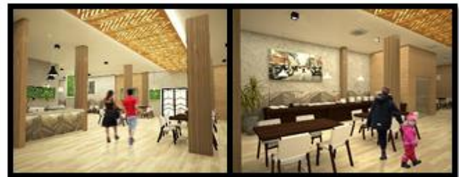
Gambar. 4. Suasana restoran hotel bisnis.