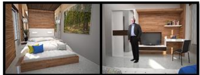
Gambar. 5. Suasana kamar eksekutif hotel bisnis.

lahir kembali dari gaya modern sehingga dapat disimpulkan bahwa pada dasarnya istilah minimalis merupakan modifikasi desain bergaya modern. Gaya minimalis merupakan arsitektur modern tetapi arsitektur modern belum tentu arsitektur minimalis.