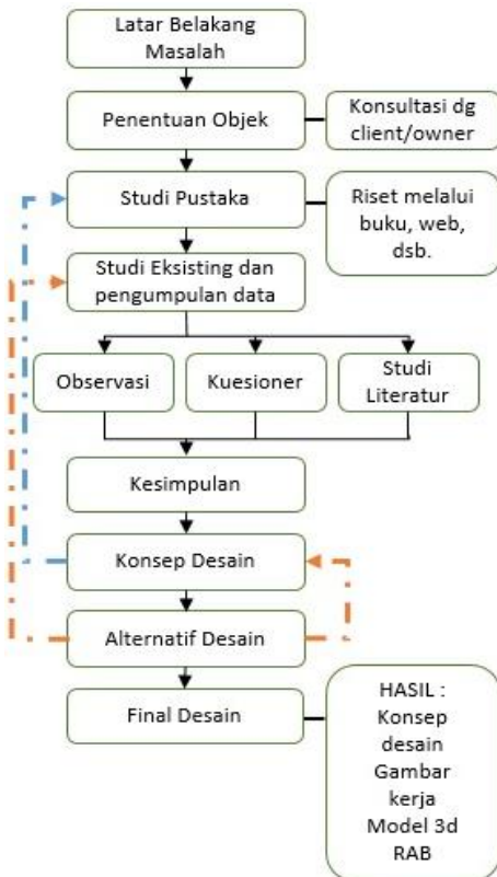
Bagan. 1. Metodologi desain.