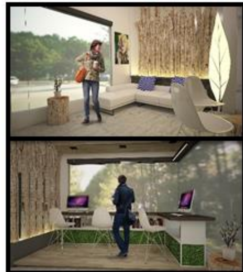
Gambar. 3. Suasana lobby hotel bisnis.