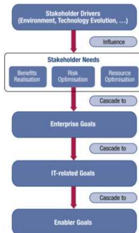
Gambar 1. COBIT 5 Goals cascade overview