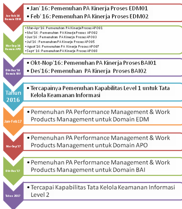
Gambar 3. Roadmap pencapaian kapabilitas sampai level 2