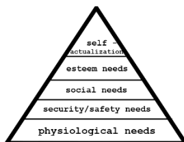
Gambar 1.1 Segitiga Kebutuhan Maslow

Motivasi merupakan hal yang akan mendorong konsumen untuk mengembangkan perilaku pembelian. Motivasi merupakan ekspresi dari seseorang akan kebutuhan yang memungkinkan seseorang untuk berusaha memenuhi dan memuaskan kebutuhannya. Hal ini secara tidak langsung bekerja dari tingkat bawah sadar dan seringkali sulit untuk diukur. Tingkat motivasi juga mempengaruhi perilaku pembelian pelanggan. Setiap orang memiliki kebutuhan yang berbeda seperti kebutuhan fisiologis, kebutuhan biologis, kebutuhan sosial, dll. Menurut (Maslow, 1943), terdapat 5(lima) tingkatan motivasi yang dapat menjadi dasar seseorang dalam berperilaku.