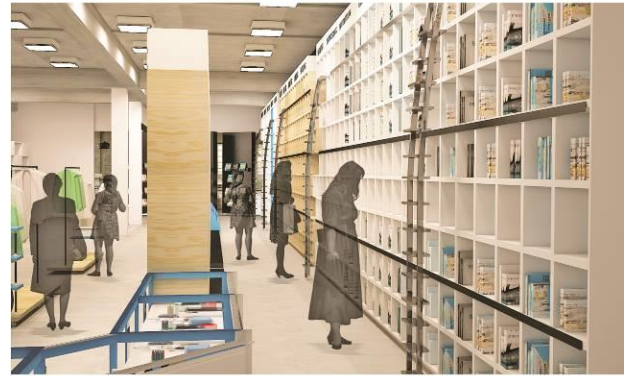
Gambar 3. Tampak Perspektif I Area Toko Buku