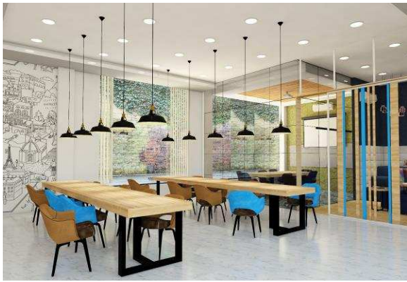
Gambar. 7. Tampak Perspektif I Area Co-Working Space