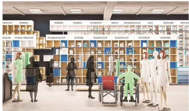
Gambar 4. Tampak Perspektif II Area Toko Buku