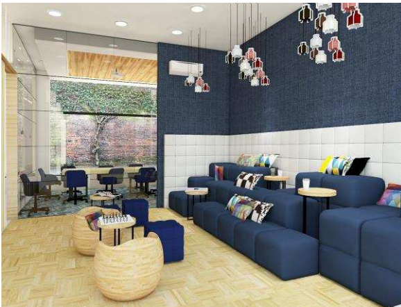
Gambar. 8. Tampak Perspektif II Area Co-Working Space

banyak jenisnya. Agar pengguna bisa bereksplorasi dan memberikan sentuhan natural maka lantai menggunakan material aci semen atau keramik dengan tekstur kasar.