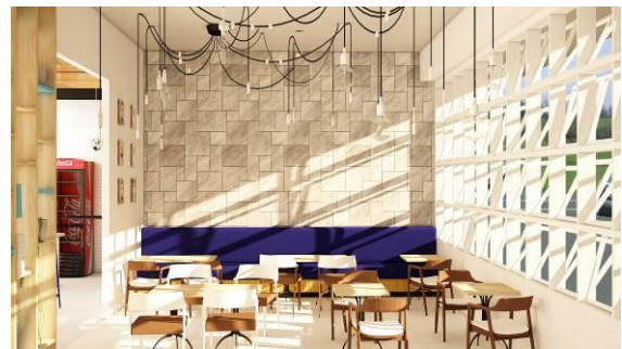
Gambar 6. Tampak Perspektif II Area Kafe