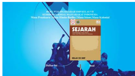
Gambar 2. Halaman Utama

Halaman utama berisi cover dan link yang merujuk pada halaman lain.