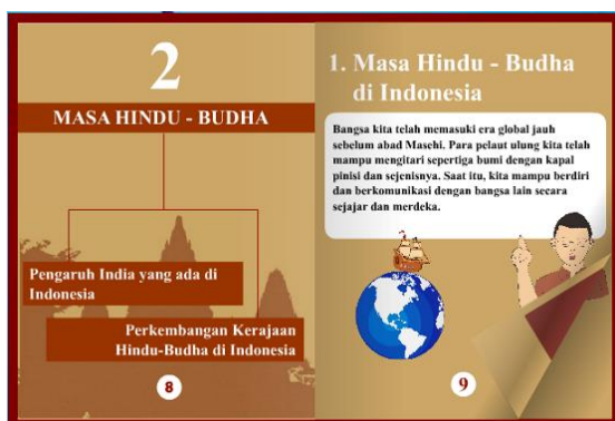
Gambar 4. Contoh Tampilan Materi dalam Buku Digital

Materi dalam Buku ini dibagi kedalam beberapa sub materi. Setian sub materi diawali dengan penyajian peta konsep dan di dalamnya terdapat animasi teks serta gambar yang akan memperjelas informasi dalam buku.