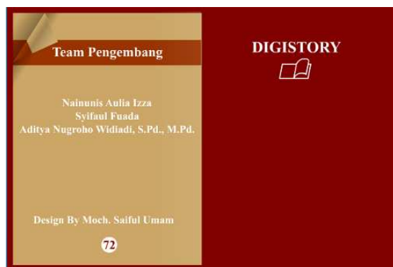
Gambar 6. Tim Pengembang