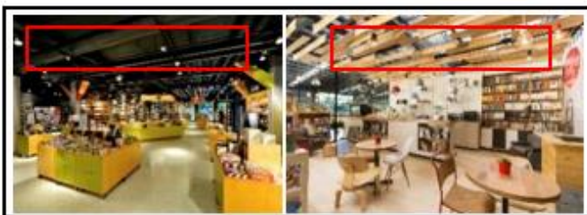
Gambar 3.1. Contoh konsep plafon