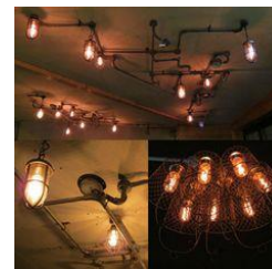
Gambar 3.7. Contoh konsep pipa pada plafon