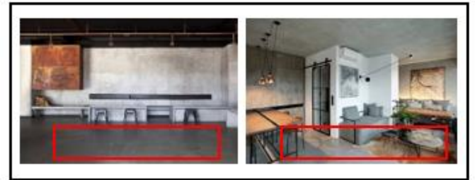
Gambar 3.4. Contoh konsep furniture