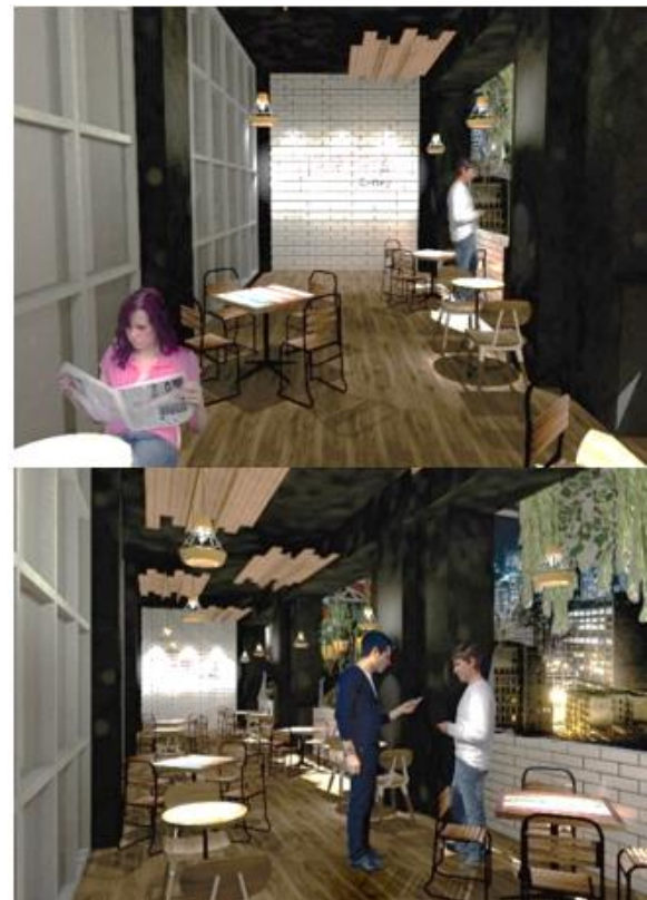
Gambar 4.3. Hasil Desain Area Toko Buku