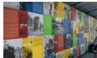
Gambar 3.5. Contoh konsep wall of fame