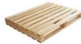
Gambar 3.5. Palet kayu untuk elemen estetis