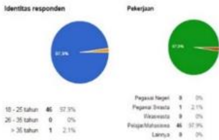
Gambar 2.1. Gambar Hasil Kuisisioner