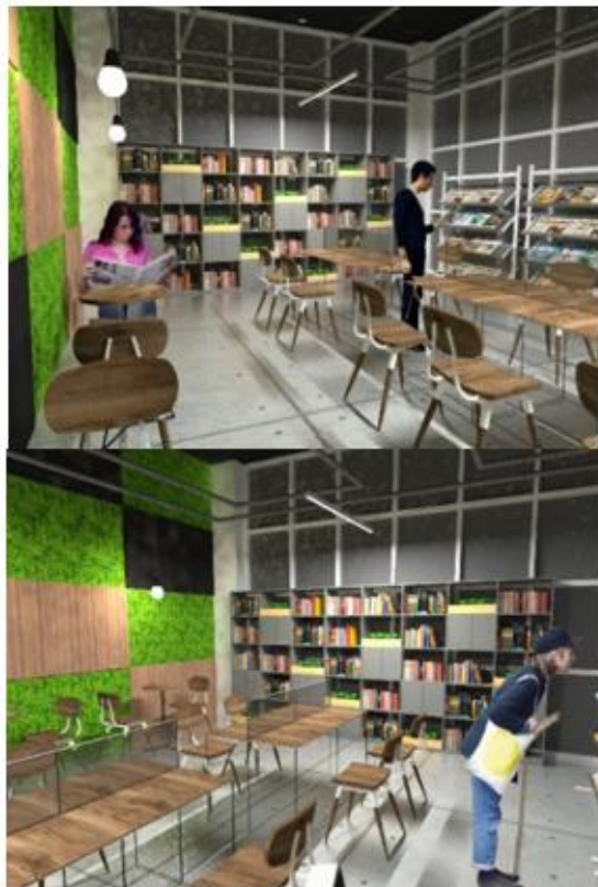
Gambar 4.1. Hasil Desain Mini Library