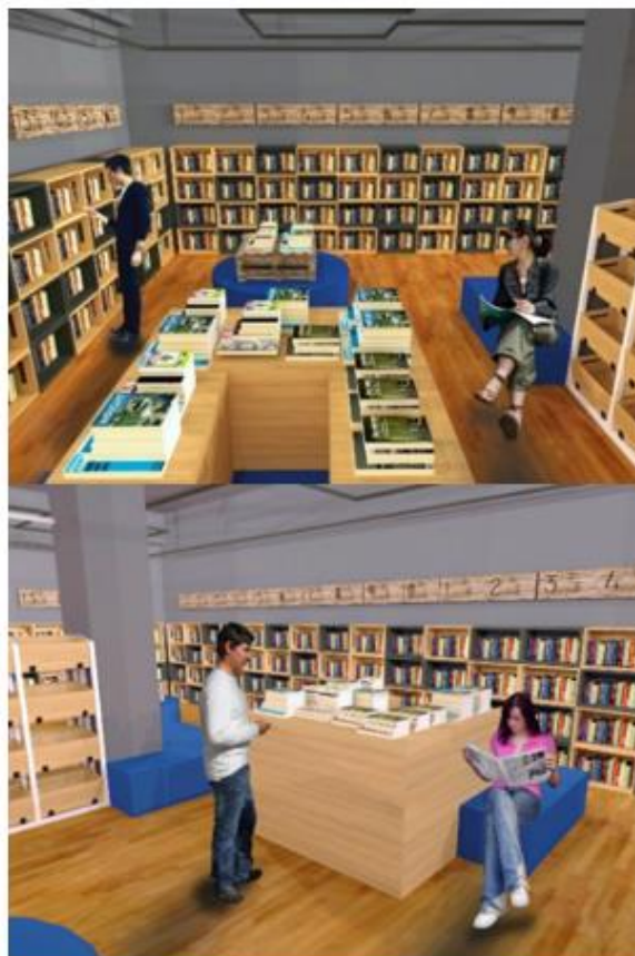
Gambar 4.2. Hasil Desain Area Toko Buku

kaum muda terutama dalam minat baca, tetapi tidak menutup kemungkinan untuk menyediakan fasilitas tambahan, seperti area seminar dan ruang serbaguna. Konsep baru mengenai toko buku diharapkan dapat bermanfaat terhadap kemajuan pengetahuan dan pendidikan di Surabaya yang memiliki potensi cukup besar di Indonesia.