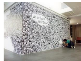
Gambar 3.6. Contoh konsep Doodle