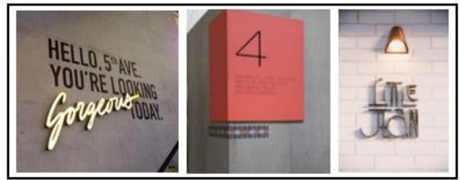
Gambar 3.3. Contoh konsep dinding