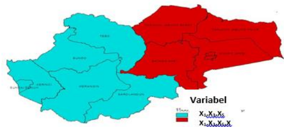
Gambar 2. Persebaran pengelompokan Kabupaten/Kota Berdasarkan kesamaan variabel yang Signifikan

Kelompok dua terdiri dari lima Kab/Kota dengan empat variabel yang berpengaruh signifikan terhadap jumlah penduduk miskin yaitu PDRB ADHB per kapita ( X_1 ), Kepadatan penduduk ( X_3 ), Persentase rumah tangga yang menempati rumah dengan status tidak milik sendiri ( X_5 ), dan Jumlah fasilitas kesehatan ( X_6 ).