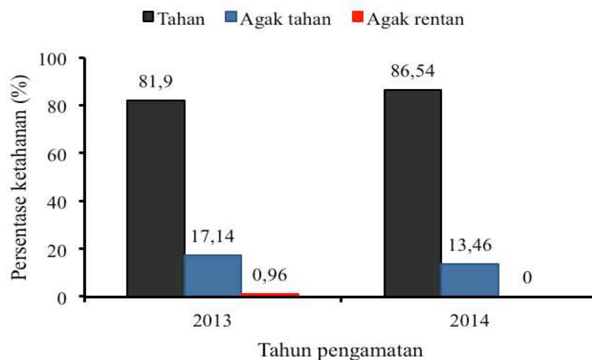
Gambar 2. Stabilitas ketahanan pohon induk kopi Liberika Meranti terhadap penyakit karat daun ( H. vastatrix ) tahun 2013–2014 Figure 2. Resistance stability of Meranti Liberica coffee to leaf rust disease ( H. vastatrix ) in 2013–2014

Mekanisme ketahanan tanaman kopi terhadap H. vastatrix yang lain adalah ditemukannya prekursor lignin yang mampu membentuk lignifikasi sebagai reaksi terhadap infeksi. Induksi lignifikasi dinding sel pada jaringan yang terinfeksi jamur merupakan salah satu sistem pertahanan struktural tanaman. Peningkatan kandungan lignin ini dapat menghambat penetrasi dan invasi patogen secara fisik, memblokir penyebaran toksin dan enzim yang dikeluarkan oleh patogen, serta menghambat pasokan nutrisi yang dibutuhkan patogen (He, Hsiang, & Wolyn, 2002). Tanaman kopi yang tahan mengandung prekursor lignin tinggi sehingga mampu mengadakan lignifikasi. Lignifikasi dapat terjadi pada pembuluh kecambah H. vastatrix dan mulut kulit daun (Semangun, 2000; Silva et al. , 2006).