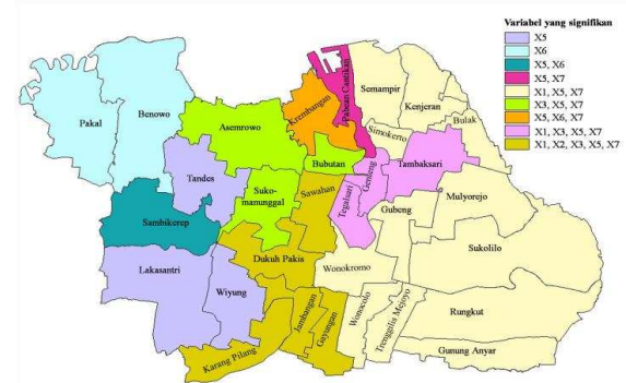
Gambar 3. Pengelompokkan Kecamatan Berdasarkan variabel yang Signifikan

Pengelompokkan wilayah yang terbentuk terhadap signifikansi variabel ditampilkan pada Gambar 3.