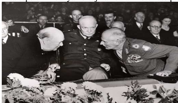
Gambar ini menunjukkan beberapa pimpinan pasukan sekutu salah satunya Winston Churchill yang sedang bercakap-cakap di sela sebuah event atau foto di bawah ini

Kekuatan kebohongan semiotik dapat terlihat dalam corak realitas surealisme yang dihadirkan dalam foto-foto kematian atau perburuan Osama ini. Ini terlihat dalam hal-hal sebagai berikut. Pertama , setiap tanda yang dihadirkan dalam visual bukanlah gambaran realitas sebenarnya, realitas yang sama bisa ditemukan pada peristiwa yang lain. Semua hanya menghadirkan relasi tidak langsung yang artinya menciptakan representasi di atas representasi. Foto tentang Obama dan stafnya misalnya pada dasarnya tidak menggambarkan atau merepresentasikan secara langsung sebuah event pemberantasan terorisme atau pembunuhan, hanya sebuah perayaan seperti sebuah pesta dansa atau sebuah percakapan disela-sela kejadian lain. Gaya foto berita seperti ini banyak disajikan dalam foto foto pada saat perang dunia kedua.