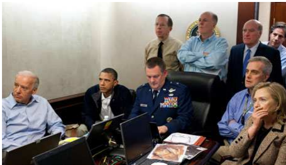
Foto yang paling terkenal dikaitkan dengan event kematian Osama adalah foto karya Pete Soza dari kantor berita Associated Press dan diterbitkan oleh Kompas dengan tajuk menteri luar negri AS ( Kompas , Rabu 4 Mei 2011, headline ).

Foto ini hanya menjelaskan sebuah kegiatan dari beberapa pimpinan negara adidaya Amerika Serikat. Sebenarnya kegiatan ini sering juga dilakukan, mungkin adegan ini bisa terlihat untuk sebuah peristiwa seperti makan malam bersama atau pun rapat gabungan di Gedung putih, sebuah sekwen yang sebenarnya tidak memberikan secara langsung diskursi tentang sebuah peristiwa seperti kematian Osama. Hanya sebuah “nonton bareng” yang dikaitkan dengan event Osama. Yang artinya yang ditawarkan bukanlah sebuah visualisasi tetapi sebuah realitas tentang kematian Osama yang bereferensi pada sebuah hubungan. Dan hubungan-hubungan antarfragmen dan logika sebenarnya adalah sebuah citra murni yang bisa di- counterfeit -kan dengan realitas lain dengan menggunakan potongan realitas entah realitas baru atau pun nostalgia. Sehingga foto ini menghasilkan sebuah narasi kecil yang kemudian dalam hubungan signifikasi menciptakan sebuah cerita besar tentang kematian Osama itu sendiri.