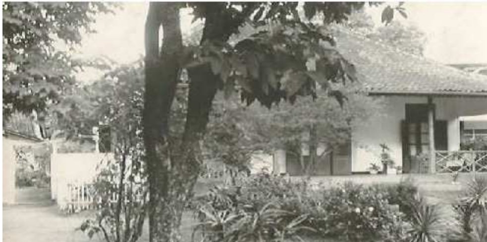
Gambar 2 Rumah Cibadak sekitar 1970

barang perhiasannya. Di luar, dia dijemput oleh seseorang dan dibawa naik mobil langsung ke rumah Tan Sim Tjong di Cibadak. Saat itu Tjeng Hoe sudah bekerja di Tegal setelah berhenti kerja dari perusahaan Belanda De Waal & Co. di Bandung. Hampir seluruh anggota keluarga Sim Tjong terbangun. Hermine tampak gugup serta kebingungan dan terjadilah pembicaraan dengan Sim Tjong. Kemudian, mereka berdua berjalan kaki menuju rumah sahabat Sim Tjong yang terletak sekitar 80 meter dari rumahnya (bernama samaran Harlot), orang Eropa yang biasa mengurus perkara di pengadilan. Di sanalah pertama kali tempat persembunyian Hermine (Chabanneau, 1918: 208-215).