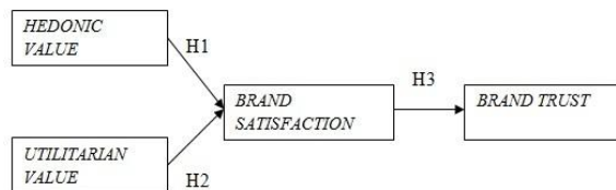
Gambar 1 Kerangka Konseptual