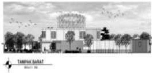
Gambar 6. Tampak Barat