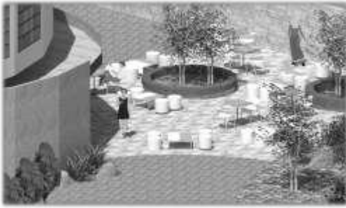
Gambar 9. Cafeteria