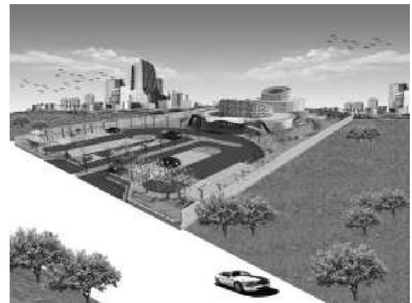
Gambar 7. Prespektif