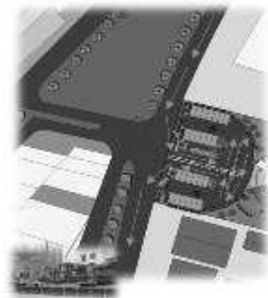
Gambar 8. Sirkulasi bangunan