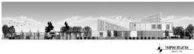
Gambar 3. Tampak Selatan