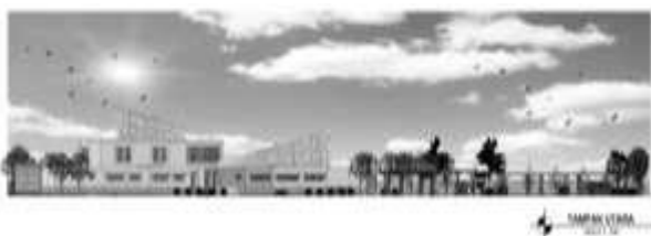
Gambar 5. Tampak Utara