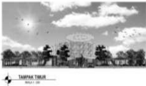
Gambar 4. Tampak Timur