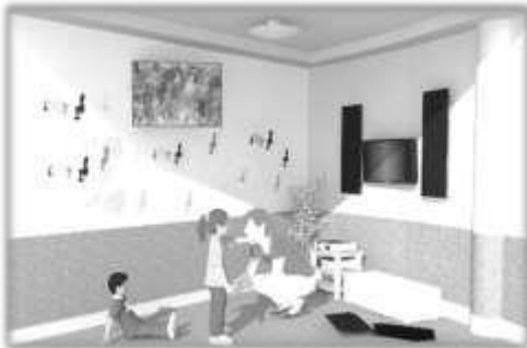
Gambar 11. Interior Terapi Musik