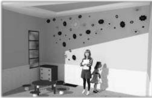
Gambar 10. Interior Terapi Wicara