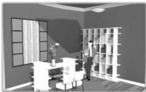
Gambar 12. Interior Terapi Medikametosa

Asperger dari suatu fenomena atau isu yang melatar belakangi tujuan, kemudian diaplikasikan terhadap tapak atau lokasi yang dipilih agar dapat terancang dengan baik.