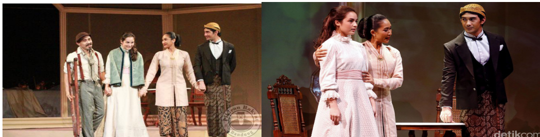
Gambar 1 Kostum yang digunakan para pemain

Dalam pementasan ini pun, salah satu yang membuatnya berhasil dan lebih menarik adalah bantuan teknologi. Salah satu yang digunakan untuk “mengomunikasikan sesuatu”