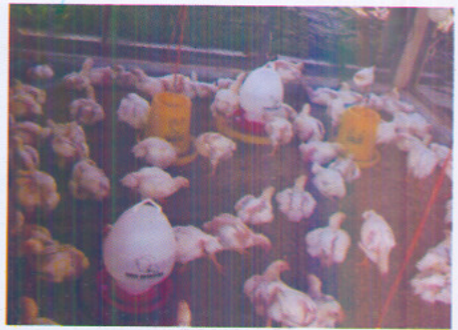
Gambar 4. Perkembangan kondisi ayam 7 hari pasca infeksi, terlihat lebih aktif, nafsu makan dan minum membaik.

Perkembangan ayam selama 7 hari dimonitor, dicatat jumlah ayam sakit dan mati. Setelah pengobatan berlangsung 5 hari, secara umum teramati ada perbaikan penampilan, nafsu makan dan minum membaik dan ayam mulai aktif bergerak, dan penyebaran ayam merata, meskipun beberapa yang sakit parah masih terlihat. Perkembangan kondisi ayam tersebut terus membaik pada hari ke-7 pengobatan (Gambar 4).