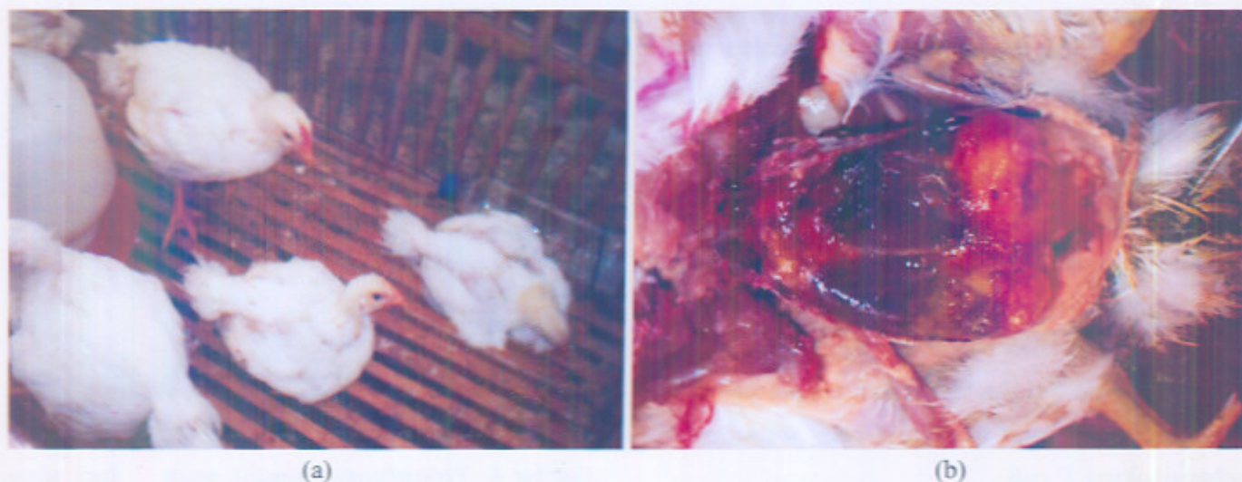
Gambar 5. Kondisi ayam kontrol pada hari ke-9 tetap buruk (a), sedangkan pemeriksaan potologi teramati lesi cukup berat antara lain: peritonitis hebat, perihepatitis fibrinosa, pericarditis fibrinosa dan airsakulitis (b)

Lesi makroskopis akibat infeksi E. coli tersebut sesuai dengan laporan penelitian Peighambari dkk. (2000) dan Pourbakhsh dkk. (1997) yang melakukan inokulasi E. coli patogenik secara aerosol dan intra thorak, mampu menimbulkan lesi airsakulitis yang konsisten. Hasil penelitian yang disampaikan oleh Barner dan Gros (1997) infeksi E. coli patogenik menginduksi lesi perikarditis, yang teramati adanya penebalan dan kekeruhan pada pericardium. Pada kasus tersebut biasanya epikardium tampak berair dan tertutup eksudat kekuningan. Hasil yang sama