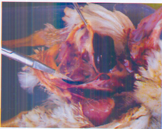
Gambar 3. Lesi organ 48 jam pasca-infeksi teramati peritonitis, dan mulai teramati masa koli yang berwarna kekuningan di penggantung usus.

Ayam sakit karena proses infeksi buatan yang teramati pada hari ke-2 pasca infeksi diambil sampel ayam bedah untuk mengetahui lesi yang ditimbulkan dan dilakukan reisolasi. Secara makroskopis lesi terlihat peritonitis, penggantung usus mulai teramati kekeruhan dan terdapat masa koli (Gambar 3). Secara umum lesi baru teramati berkembang pada lokasi yang menjadi tempat inokulasi, dan belum ada penyebaran lesi ke organ lain. Reisolasi dan identifikasi sampel masa koli di penggantung usus tersebut dapat dikonfirmasi sebagai bakteri E. coli .