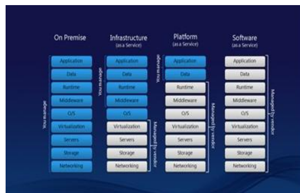
Gambar 3. Stack layanan Cloud Computing

Perbedaan SaaS , PaaS dan IaaS dapat dilihat dari sisi kendali atau tanggung jawab yang dilakukan oleh vendor penyedia jasa layanan cloud maupun customer . Pada gambar 2, di situ dijelaskan stack (jenjang) teknologi komputasi dari Networking naik hingga ke Application . Dijelaskan sampai di stack mana suatu vendor layanan cloud memberikan layanannya, dan mulai dari jenjang mana konsumen mulai memegang kendali dan bertanggung jawab penuh pada stack di atasnya.