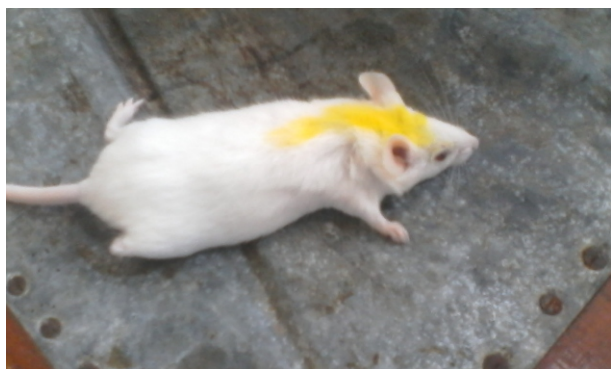
Gambar 2. Depresi dan bulu berdiri terutama pada daerah tengkuk/leher