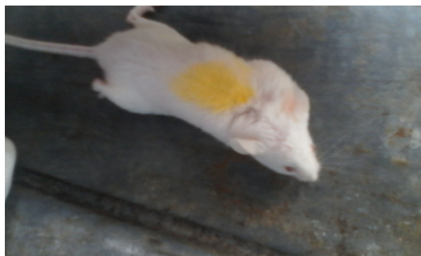
Gambar 3. Gejala syarafi berupa inkoordinasi lokomotor sebelum kematian

Dikarenakan masih terjadi kematian maka pengujian dilanjutkan dengan tahap selanjutnya yaitu menurunkan dosis menjadi 50 mg/kg bb. Pada tahap 2 digunakan 6 ekor mencit betina dibagi menjadi kelompok perlakuan (KP) dan