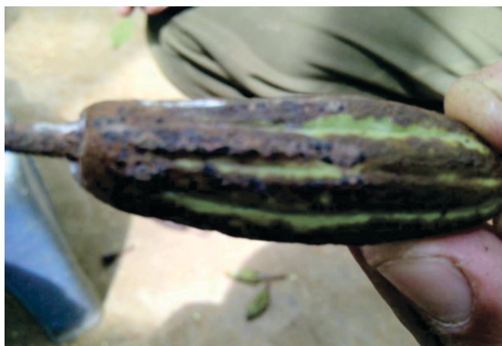
Gambar 2. Buah kecil yang dipenuhi oleh tusukan nimfa Figure 2. Small fruit filled by nymph's puncture