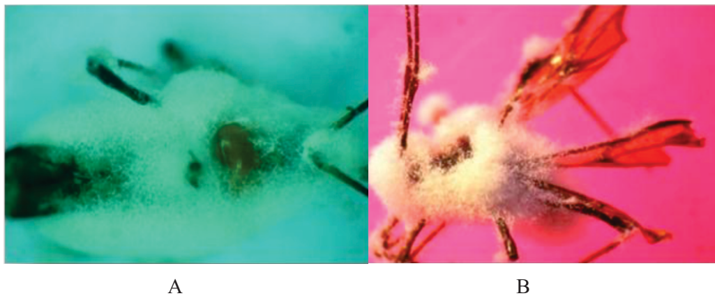
Gambar 4. Kemunculan hypha B. bassiana strain Ed7 (A) dan strain BBL (B) Figure 4. Hypha emergence of B. bassiana strain ED7 (A) and strain BBL (B)

(Tabel 8). Berdasarkan hasil pengujian ini BBL tidak menjadi pilihan untuk diaplikasikan pada pertanaman kakao.