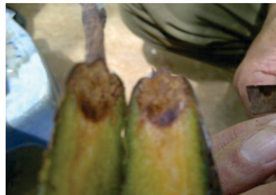
Gambar 3. Jaringan buah kakao bagian dalam yang mulai membusuk Figure 3. Inside cocoa fruit tissue start rotting