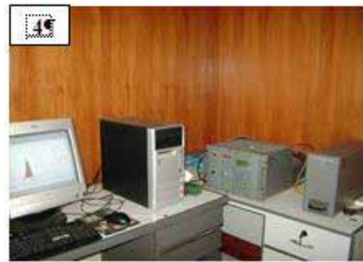
Gambar 4. Sistem TLD-reader yang digunakan untuk membaca TLD (8)