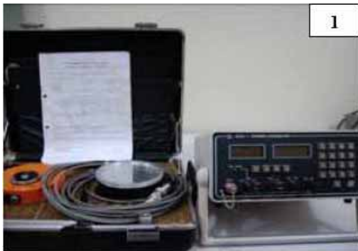
Gambar 1. Alat standar tingkat proteksi yang dimiliki LMR-PTKMR: detektor kamar ionisasi 600 ml :NE 2575#135 yang dirangkai dengan elektrometer Farmer: NE 2570/1B #1319 untuk pengukuran kerma udara