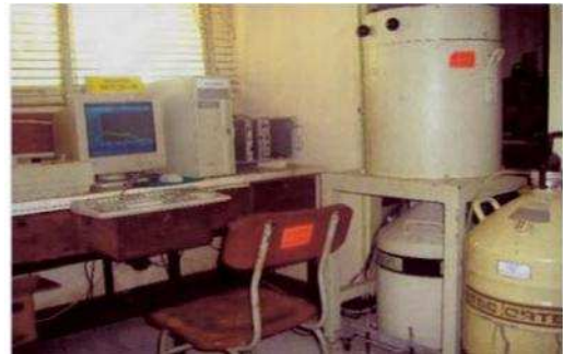
Gambar 2. Spektrometer sinar gamma di lab. cacah PSTNT, BATAN, Bandung.

digunakan untuk kalibrasi energi dan kalibrasi efisiensi. Kalibrasi energi pada MCA dilakukan dengan menggunakan sumber standar titik multi energi yang berisi nuklida ^{241}\text{Am} (59,5 keV); ^{137}\text{Cs} (661,6 keV); dan ^{60}\text{Co} (1173 keV dan 1332 keV) [14].