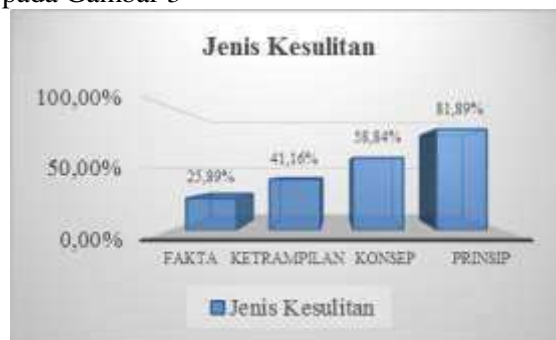
Gambar 3 Diagram Persentase Jenis Kesulitan 95 Siswa

Persentase jenis kesalahan siswa disajikan pada Gambar 3