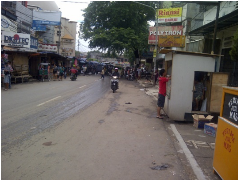
Jl. Bojongsoang, arah menuju lokasi RW 14, Desa Citeureup