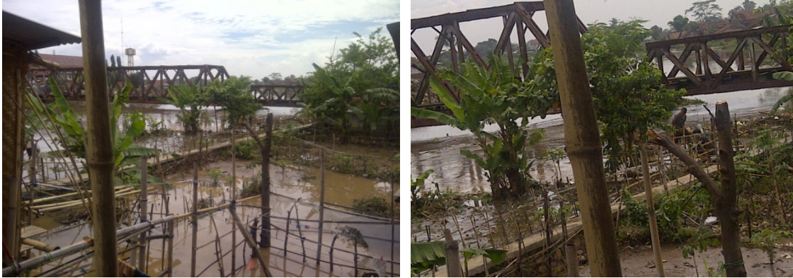
Jembatan kereta api yang melintasi sungai Citarum