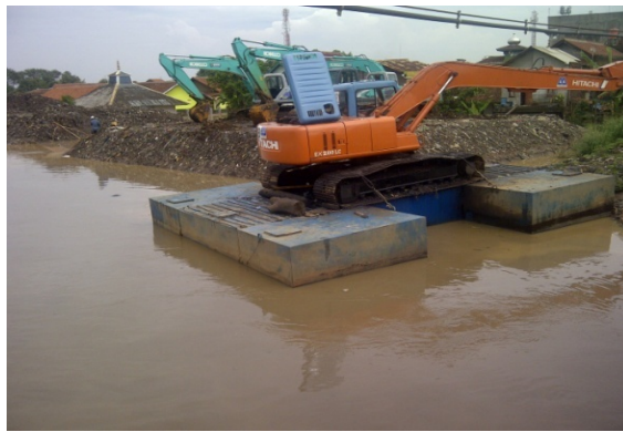
Alat berat yang disiapkan untuk melakukan pengerukan di tepi sungai Citarum, samping kanan Jembatan Citarum (dari arah bojongsong)