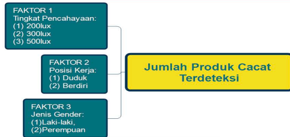
Gambar 5. Kerangka berpikir (variabel independen dan dependen)

gender laki-laki dan perempuan, nilai IQ 90-120 yang terlebih dahulu dilakukan test intelegensi umum (Azwar,2006), waktu pengamatan selama 2.20 jam. Desain eksperimen berjumlah 12 desain eksperimen yang merupakan manipulasi dari variabel independen, seperti yang tergambar pada gambar 5 berikut ini: