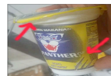
Gambar 3. Cacat Produk Volume Kurang