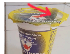
Gambar 2. Cacat Produk Seal Tidak Merekat Sempurna atau Cup Bocor

Objek penelitian adalah visual inspection task pada minuman kemasan cup merk “Panther” untuk mengidentifikasi cacat. Adapun karakteristik atau kategori cacat yaitu volume kurang (Vk), Cup bocor (Cb), Gambar tidak pas (Gtp).