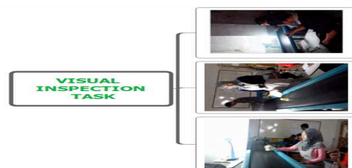
Gambar 7. Visual Inspection Task Pada Minuman Kemasan Panther