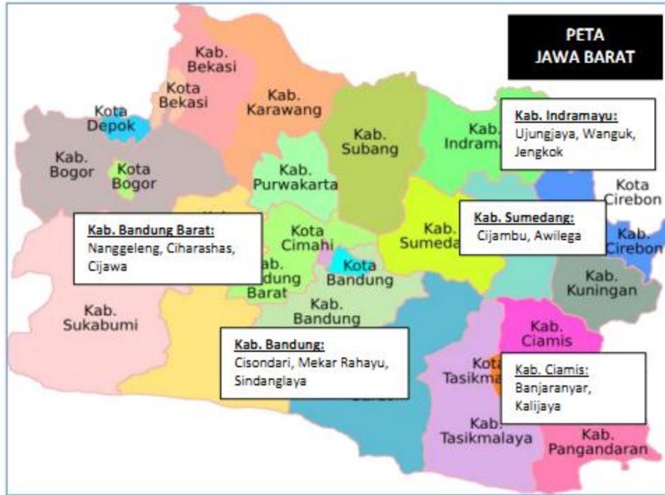
Gambar 2. Peta Lokasi Sebaran Koperasi dan Credit Union Mitra Kegiatan PkM Prodi EP UNPAR