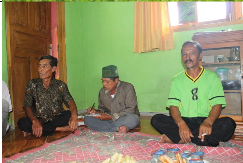
Pelatihan Pertanian Organik di Sumedang, Januari 2015