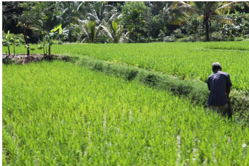
Pelatihan Pertanian Organik di Sumedang, Januari 2015