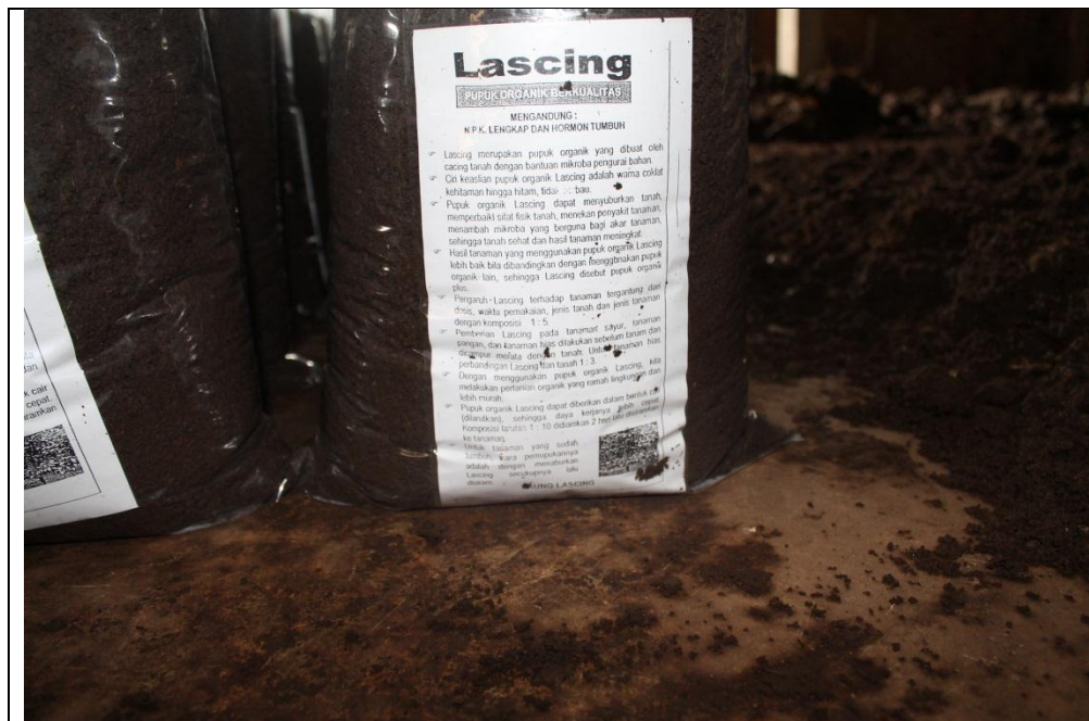
Kunjungan lapangan ke Usaha Lascing Keuskupan Bandung di Kuningan