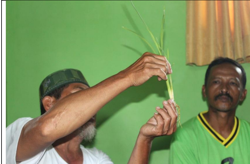
Pelatihan Pertanian Organik di Sumedang