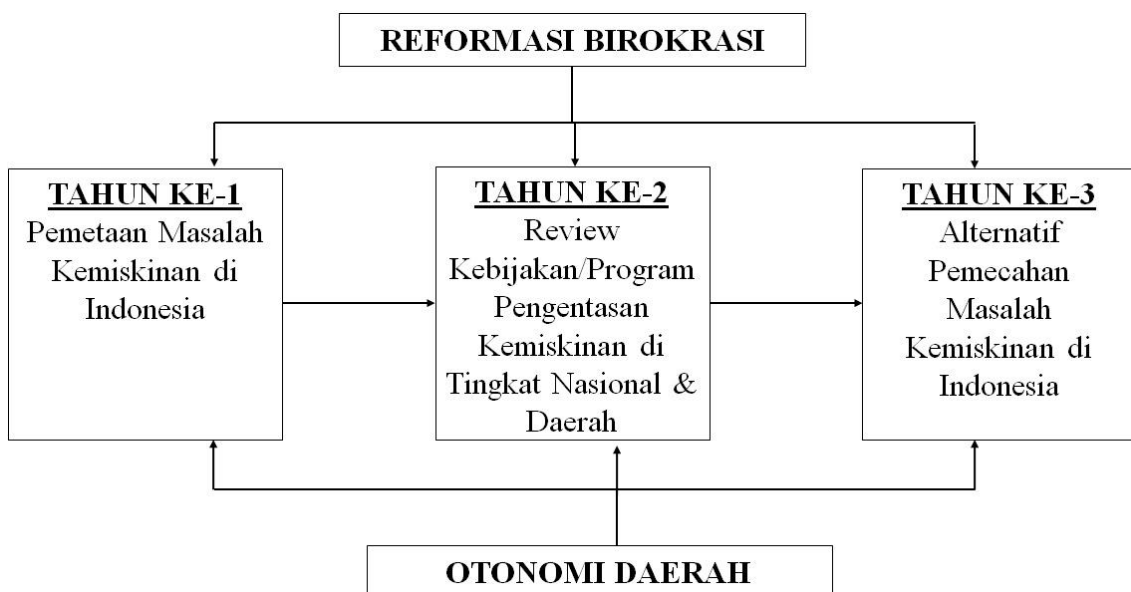
GAMBAR 3.2 Rencana Induk Pengembangan Otonomi dan Desentralisasi Daerah

Penelitian ini akan dilakukan dalam beberapa tahapan penelitian seperti yang sudah dijelaskan di 3.1. (tahapan penelitian) dengan periode penelitian selama satu tahun (Februari 2015 sampai dengan November 2015). Sesuai dengan Rencana Induk Penelitian UNPAR maka penelitian ini akan menjadi bagian dari Roadmap atau Peta Jalan Penelitian Bidang Otonomi dan Desentralisasi Daerah yang digambarkan sebagai berikut: